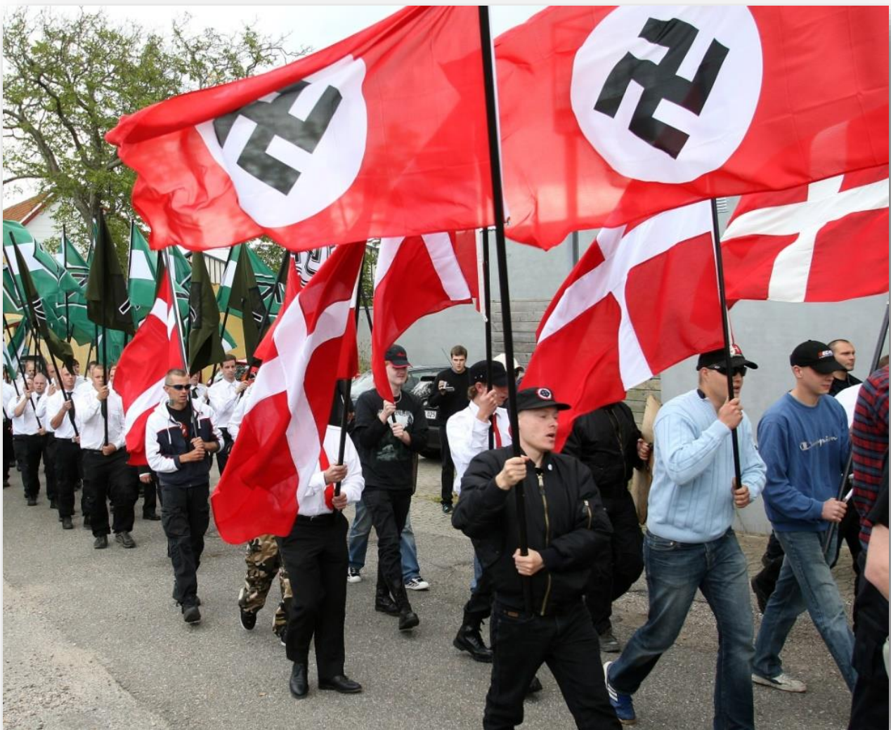
Nynazistisk optog i Kolding 2007

Nynazisme er en politisk bevægelse, som bygger videre på nazisternes ideer. Nynazisterne er nationalistiske og har oftest et voldsomt had til minoritetsgrupper (også andre end jøder)