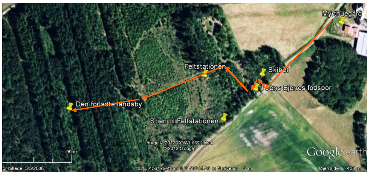
Kortudsnit nederst: 1 km i alt Opdagelsesrejsende ca. 2 timer el- ler for de yngste børn