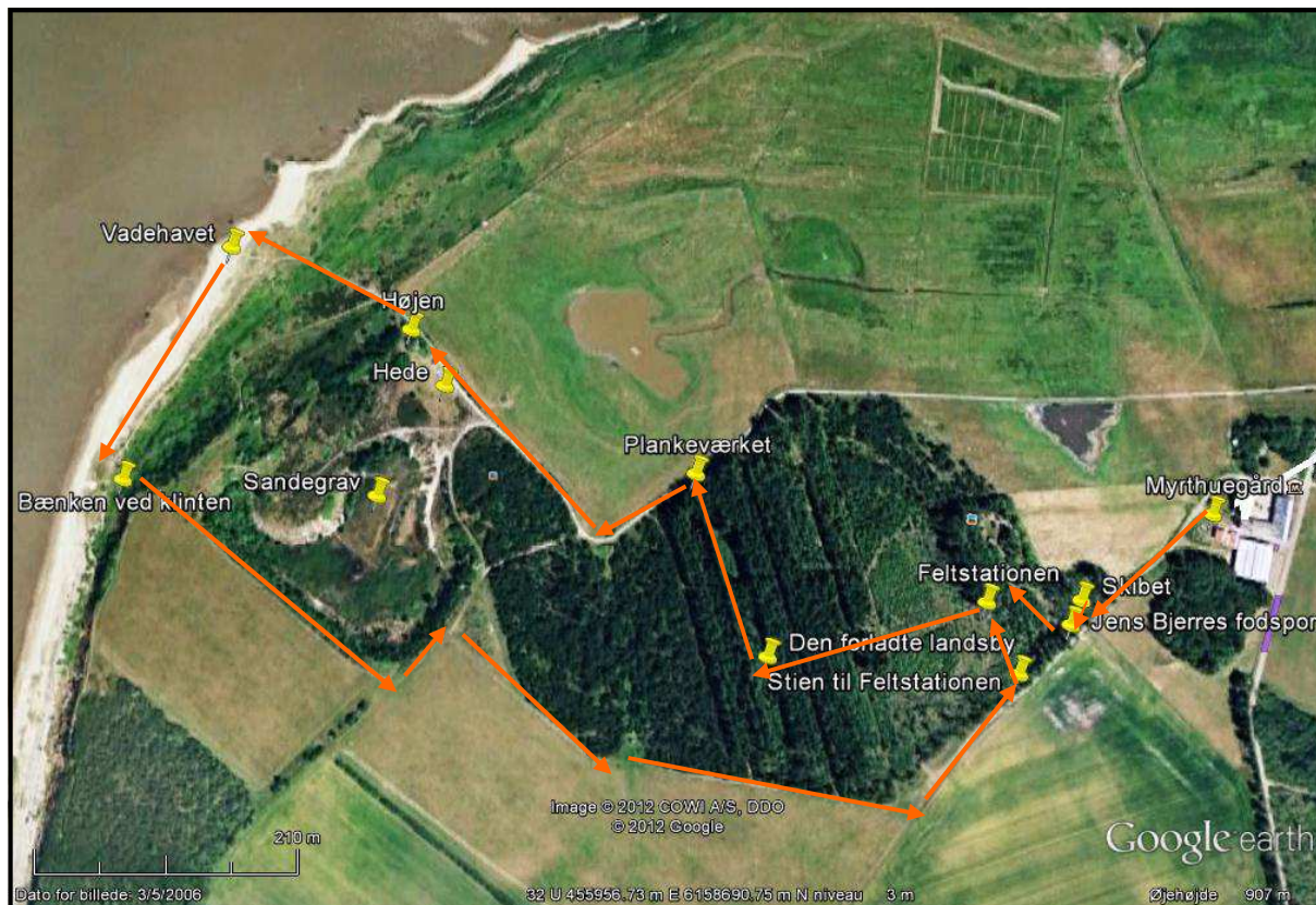
Kortudsnit øverst: 2,5 km i alt Opdagelsesrejsende ca. 4 timer